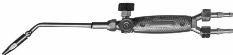
Рис.1- Общий вид горелки

Горелка состоит из ствола и комплекта наконечников. Ствол горелки имеет регулировочные вентили кислорода и пропан-бутана. К стволу по резиновым рукавам